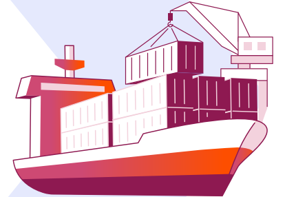
Nihai alıcılar (deniz taşımacılığında)