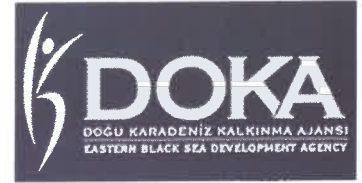
DOKA DOĞU KARADENİZ KALKINMA AJANSI EASTERN BLACK SEA DEVELOPMENT AGENCY